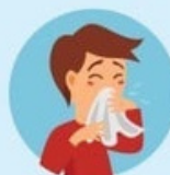
Близко не находиться с чихающими и кашляющими людьми