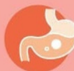
Проблемы с ЖКТ у детей