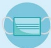
Носить маску и менять ее каждые 2 часа