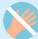
Не трогать глаза, рот и нос немытыми руками