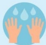
Мыть руки как минимум 20 секунд